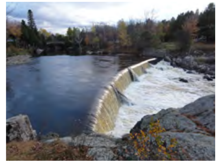
Un barrage existait déjà sur ce site vers 1832 à Sainte-Claire. Cette structure de type béton-voûte a été construite en 1935 sur la rivière des Abénaquis.

La modernisation des barrages utilisés par d'anciens moulins à eau s'est faite à l'époque où l'eau commen-