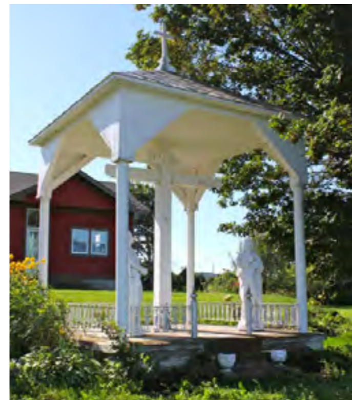
Ce calvaire avec son édicule et ses colonnes fait partie des 25 trésors du patrimoine religieux québécois. La statue du Christ est remise en attendant sa restauration.

La croix commémorative rappelle habituellement le site d'un événement. La croix de fondation souligne