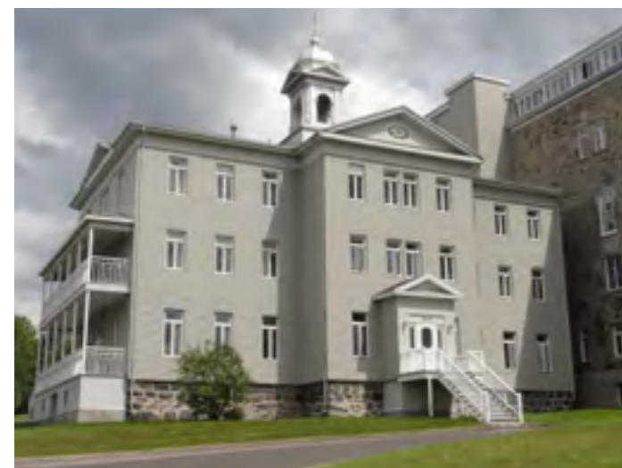
Le patrimoine religieux avait été exclu au départ, mais les fiches existantes furent néanmoins mises à jour, comme celle de ce couvent de Saint-Damien.