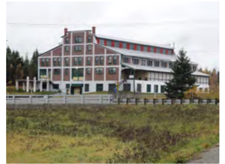
L'économie de Bellechasse a longtemps reposé sur l'exploitation de moulins à scie. Le plus important, situé à Saint-Damien, est le Moulin Goulet, construit en 1930 et qui fut en opération jusqu'en 1970. Il a été reconverti.

La majorité de ces moulins furent établis sur un ruisseau éclusé ou tout près d'une chute d'eau; la puissance de l'eau faisait tourner une grande roue à aubes qui actionnait à son