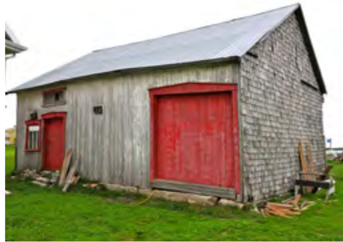
Ce bâtiment rappelle l'époque des petites écuries situées derrière la maison. Aujourd'hui, il est devenu hangar, remise, entrepôt, garage ou atelier.

a varié dans le temps selon les usages qu'en ont faits leurs propriétaires ou selon le vocabulaire local : les termes garage, remise, atelier, entrepôt et hangar désignent souvent le même bâtiment multifonctionnel qui regroupe des utilisations habituellement confinées au sous-sol de la maison en milieu urbain.