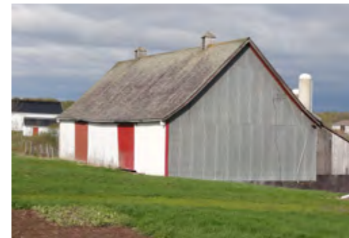
Cette grange de Saint-Charles conserve plusieurs de ses caractéristiques d'origine : toit retroussé en bardeau, planches verticales, lanterneaux et portes coulissantes. Ses extrémités sont malheureusement recouvertes de tôle profilée.

La généralisation de cette menace touche surtout les