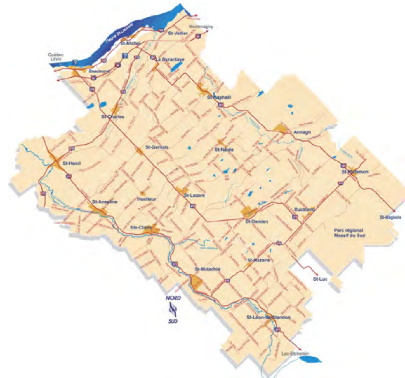
Figure 1 : Carte de la MRC de Bellechasse

former les personnes impliquées, assurer le financement du projet, mieux cerner les difficultés et les exigences de l'opération, etc. Dès le début de l'été, le travail fut entrepris de façon systématique dans la municipalité de Saint-Charles-de-Bellechasse, où se situe le siège social de la Société historique de Bellechasse, donc plus facile d'accès, avant d'entreprendre les municipalités de Saint-Lazare, Saint-Damien, Notre-Dame-Auxiliatrice-de-Buckland et Beaumont, toutes situées le long de l'axe de la route 279. Pour éviter de multiplier les fiches à décrire, les bâtiments