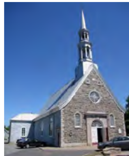
L'église Saint-Étienne de Beaumont est la seule à se mériter la cote A.