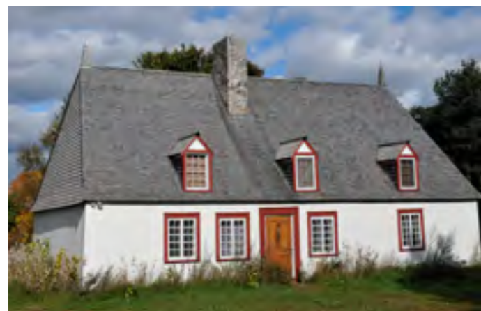
La maison Molleur-Dit-Lallemand, premier bien classé en 1970 dans Bellechasse, est une habitation d'inspiration française construite en 1720 et agrandie au XIX e siècle.

L'inventaire du patrimoine bâti de la MRC de Bellechasse, réalisé entre 2010 et 2012, a mis en évidence des différences notables pour certains bâtiments anciens décrits et photographiés lors des inventaires précédents, en 1998 et en 2003-2004. Les analyses comparées montrent une tendance inquiétante dans l'évolution du patrimoine bâti de Bellechasse, une tendance qui pourrait même menacer l'existence de cet héritage dans un futur pas si lointain. Il faut se consoler en constatant