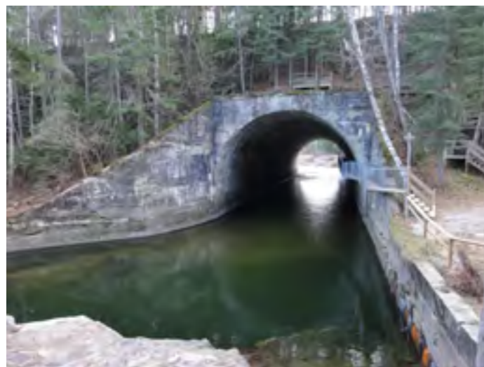
Ce ponceau de chemin de fer voûté sous remblai a été construit vers 1910 par la compagnie « Transcontinental Canadien », au-dessus de la rivière Armagh.

Seulement deux barrages avaient été décrits lors des travaux d'inventaire sur le terrain entre 2010 à 2012. Des observations additionnelles et la consultation du répertoire des barrages du Centre d'expertise hydrique du ministère du Développement durable, de l'Environnement, de la Faune et des Parcs ont permis d'identifier et de localiser une trentaine de structures ayant un intérêt patrimonial reconnu ou présumé du fait qu'ils ont été construits avant 1950. Parmi les barrages les plus vieux qui méritent d'être mentionnés, il y a celui en arc aux Abénakis à Sainte-Claire, celui de l'ancien moulin de la route Morissette à Saint-Gervais, celui du moulin Blanc à Saint-Charles-de-Bellechasse, celui du Faubourg des moulins à Saint-Gervais et le barrage hydro-électrique Jean-Guérin, aux limites de Saint-Henri et de Saint-Anselme.