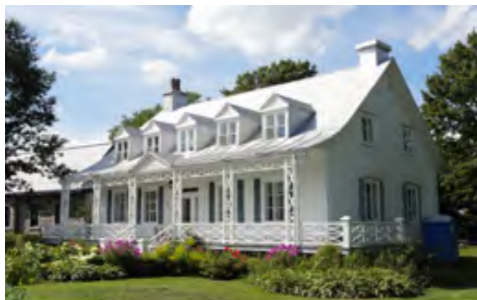
Ce deuxième presbytère de Beaumont fut construit en 1854-1855, dans le style néoclassique représentatif des maisons québécoises de l'époque. Il a été vendu en 2013.

Plusieurs des presbytères de Bellechasse comptent parmi les joyaux du patrimoine bâti de ce territoire, dont celui de Saint-Anselme, l'un des mieux réussis d'entre tous.