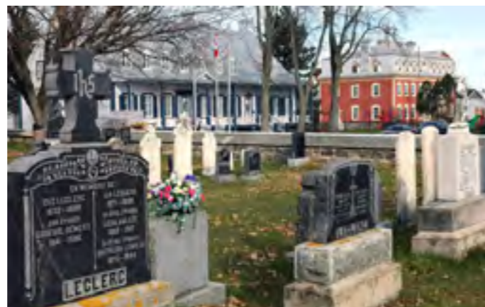
Le cimetière actuel de Saint-Charles date de 1830. Il est ceint d'un mur en pierre, qui proviendraient des murs de la première église.

Dans un avenir rapproché, il serait opportun de procéder à un inventaire plus descriptif des cimetières pré-