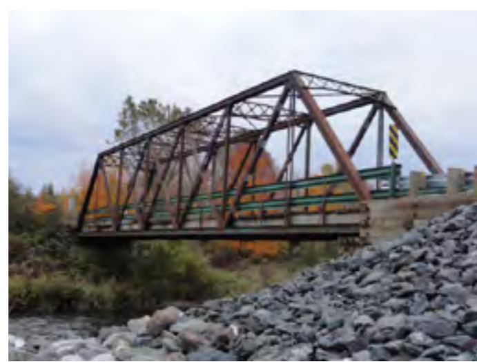
Ce pont en acier à tablier inférieur a été construit en 1893; il est situé à la limite de Saint-Vallier et de Saint-Raphaël. Il serait le plus vieux pont de Bellechasse.