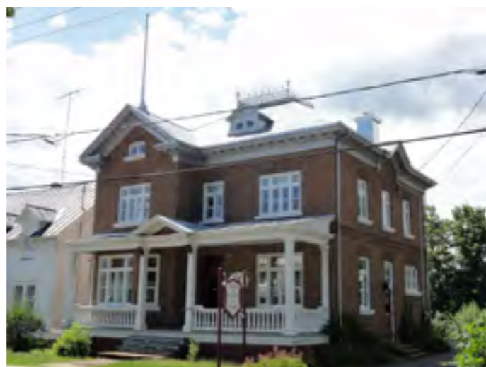
La maison du Docteur-J.-Arthur-Noé-Chabot, citée monument historique par la municipalité de Sainte-Claire, est une résidence bourgeoise bâtie en 1925 et maintenant accessible au public.

L'ancienneté des bâtiments a été révélée notamment par les techniques de construction et la nature des matériaux uti-