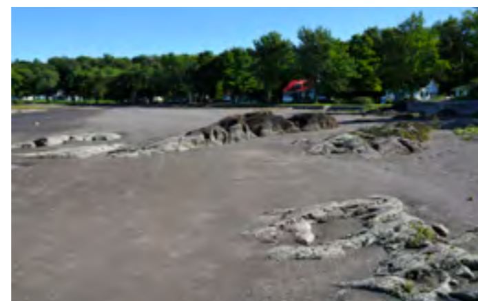
Le site de villégiature de l'anse aux Trèfles à Beaumont constitue l'un des premiers de cette nature dans Bellechasse. On y retrouve des chalets datant de 1917 et occupant de vastes terrains paysagers.

Soulignons que la Conférence régionale de la Chaudière-Appalaches a réalisé, en 2011-2012, les phases 1 et 2 de l'étude des paysages de la région avec le groupe Ruralys. La méthodologie de caractérisation et d'évaluation développée par cet organisme traite de préoccupations actuelles liées aux paysages. Cette initiative se veut un premier outil pour améliorer la gestion de ces derniers dans la région. Le partage de connaissances et la concertation permettront de faire un nouveau pas vers la prise en charge des paysages par le milieu. Dans Bellechasse, les travaux ont été concentrés sur les axes routiers 281, 279 et 277.