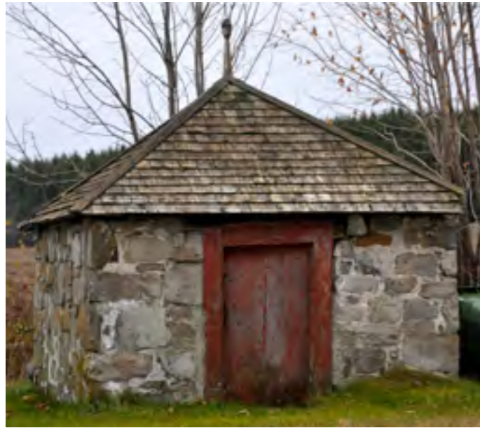
On retrouve encore quelques belles laiteries détachées, comme celle-ci, construite en pierre à Beaumont.