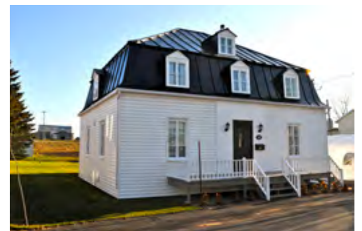
Avec son toit mansardé à 4 versants et ses lucarnes, cette maison a conservé son charme, malgré son revêtement contemporain. Elle est localisée à Saint-Michel.

Les détails architecturaux contribuent énormément à l'accroissement de la valeur patrimoniale d'un immeuble résidentiel, lorsqu'il est possible de les conserver et même de les reproduire dans le cas d'insertions en milieu ancien. Certains de ces détails pourraient