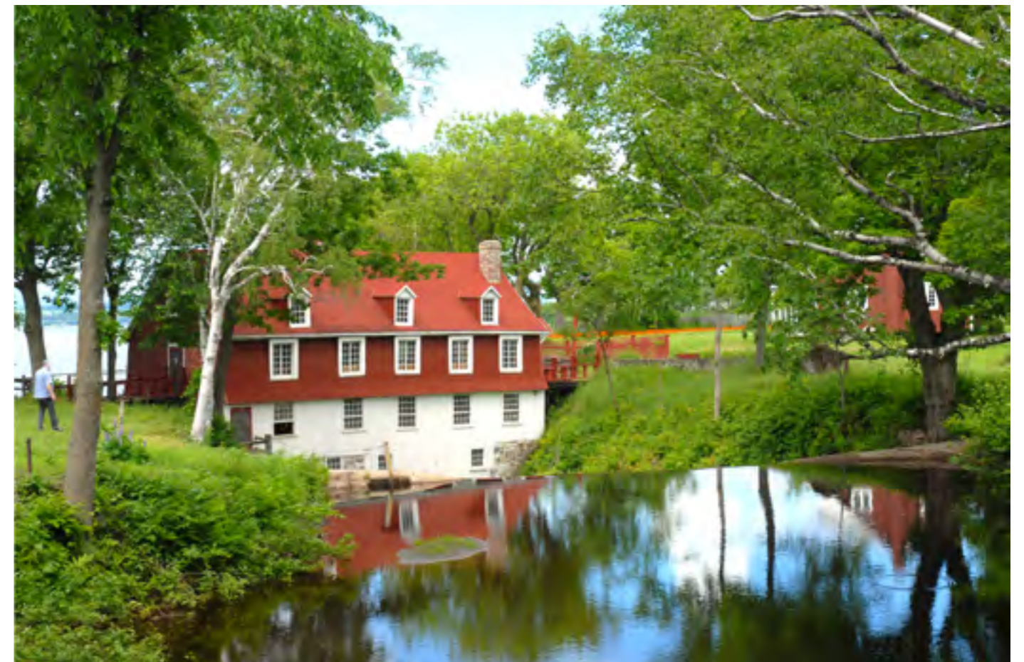
Le manoir de Beaumont, bâtiment identitaire de Bellechasse, constitue un bien protégé en vertu de la Loi sur le patrimoine culturel, alors que son environnement est désigné comme un site du patrimoine. En 2010, ces deux éléments figuraient déjà dans le répertoire du patrimoine immobilier après avoir fait l'objet d'une citation.

Il a aussi été décidé d'ignorer le patrimoine religieux, à l'exception des croix de chemin, calvaires et chapelles, afin d'éviter une duplication avec le travail d'inventaire déjà réalisé par le Conseil du patrimoine religieux du Québec; toutefois, il est apparu opportun en cours de route d'ajouter des informations manquantes, telles les descriptions physiques et historiques ou parfois cer-