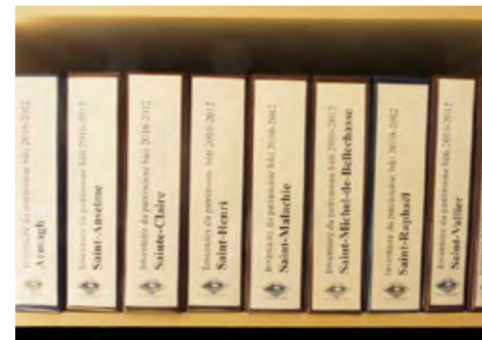
Toutes les fiches complétées sur le terrain pour chacune des 20 municipalités de la MRC de Bellechasse ont été placées dans des cartables distincts.