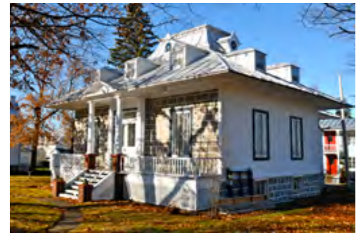
Ce cottage de style Regency, situé à Saint-Michel-de-Bellechasse, possède une magnifique ornementation. Il s'agit d'un style architectural plutôt rare.

Les plus belles maisons ont été recensées dans le cœur des villages. Avec leurs styles variés, pittoresque, néo-Queen Anne, éclectisme victorien et Arts and Crafts, elles se distinguent par leurs lignes harmonieuses et leur abondante ornementation : vastes galeries, jolis pare-soleil, planches cornières, aisseliers, balustrades en bois tourné, corniches moulurées ou à denticules, frontons, jalousies ou persiennes, poteaux ouvragés et bien d'autres fantaisies des concepteurs ou des propriétaires de l'époque. Les revêtements du toit et des murs extérieurs des immeubles résidentiels constituent les plus importants éléments d'une signature patrimoniale. Il est heureux de constater que des toits recouverts de bardeau de cèdre, tôle pincée, tôle à la canadienne ou tôle en baguettes demeurent toujours fort populaires, même lors de rénovations majeures, alors qu'on assiste à la généralisation du bardeau d'asphalte. Les toits à deux versants retroussés, les toits mansardés et les toits en pavillon font aussi partie des techniques locales de construction qui caractérisent le patrimoine bâti bellechassois.